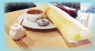
Cセットのマラドーサ 1,050円

インド料理店では北インド料理のみ を扱うところが多いのですが、チャルテ チャルテでは米粉と豆をクレープ状に 焼いた「ドーサ」などの南インド料理も 味わうことができます。