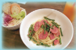
日替わりランチ(パン&サラダ・ソフトドリンク付) 500円

Twitter (@italiamesiLoose)で 日替わりランチのメニューを掲載!