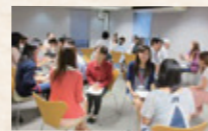
キャリアセンター職員の方々と の茶話会(=親睦会)

まず、就活に対する意識が向上しました。そして、年度末になると、企業見学で体験したことや学んだことをキャリアセンターの職員さんに対して発表するので、人前で発表する経験も出来ました。他のメンバーからは、計画力・実行力が身に付いたという意見もありました。