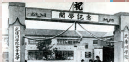
1949年 武庫川学院女子大学 開学の様子