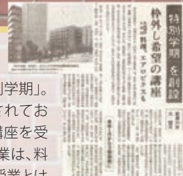
当時の神戸新聞に掲載された記事

後期が終わった2月から始まる「特別学期」。この特別学期は1986年度から実施されており、学部、学科、学年関係なく様々な講座を受講することができます。開講される授業は、料理や資格、語学、スポーツなど普通の授業とは一味違ったものばかりです。