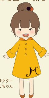
M*archのキャラクター むっちょちゃん

食堂を利用する際は、座席数に限りがあるので荷物などを置いて席を取るのはやめよう。食事が終わったら椅子をきちんと戻して、次の人が気持ちよく利用できるように意識しましょう。