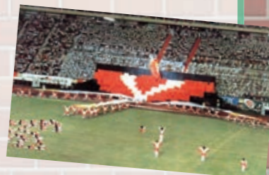
1985年、「ユニバーシアード神戸大会」の開会式

毎年恒例、武庫女の体育祭の目玉とも言える「応援合戦」には素晴らしい歴史があります。実は1988年の大晦日、「NHK紅白歌合戦」に出場していたのです。また、1970年の「大阪万博」、1985年の「ユニバーシアード神戸大会」の開会式、1997年「なみはや国体秋季大会」の前夜祭で演技を披露するなど、いろいろな方面から注目されているのです！人々に大きな感動を与える「応援合戦」に、ぜひあなたも参加してみてください。