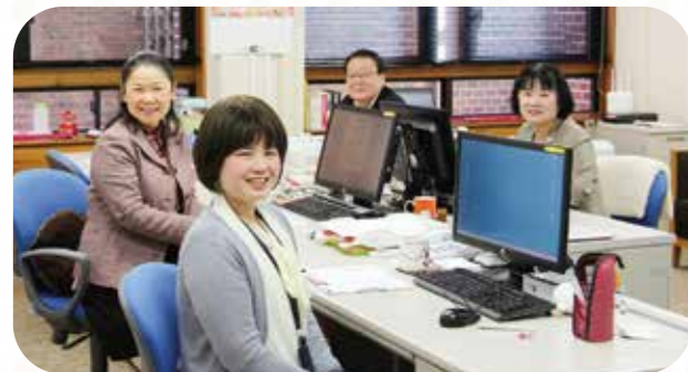
学生サポート室の職員の皆さん

A. 学修面や学生生活でサポートを必要とする学生を支援しています。どなたでも利用できますが、特にサポートを必要とする学生本人の意志や考えを尊重しながら、各学科や関係部署と連携し、サポートします。