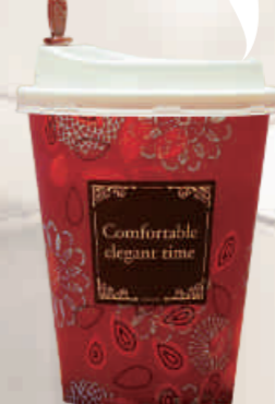
⑤ MMカフェ ¥130

甘さ ● 苦さ 香りが強い ● 香りが弱い まったり ● すっきり コスパ★★★★☆☆