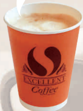
① アゼリア食堂 ¥130

甘さ ● 苦さ 香りが強い ● 香りが弱い まったり ● すっきり コスパ★★★★☆☆