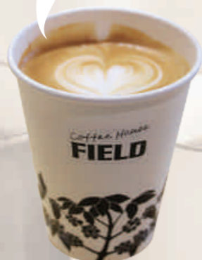
② ライブラリー・カフェ ¥200

甘さ ● 苦さ 香りが強い ● 香りが弱い まったり ● すっきり コスパ★★★★☆☆