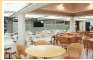
⑤MMカフェ (日下記念マルチメディア館3階)

パンの香ばしい香りに 引き寄せられるMMカフェ。 ぜひ焼きたてのパンと 一緒に優雅なひとときを。