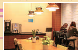
④Café C-5 (日下記念マルチメディア館2階)

2018年秋にキャリアセンターに つくられた期待のニューフェイスC-5! 学生目線で作られた こだわりの一杯に注目です。