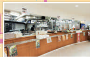
③華SAKU食堂クリステリア店 (クリステリア2階)