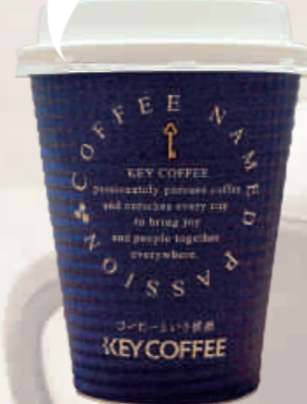
④ Café C-5 ¥100

甘さ ● 苦さ 香りが強い ● 香りが弱い まったり ● すっきり コスパ★★★★★★