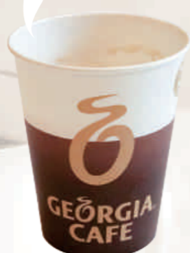
③ 華SAKU食堂クリステリア店 ¥110

甘さ ● 苦さ 香りが強い ● 香りが弱い まったり ● すっきり コスパ★★★★☆☆