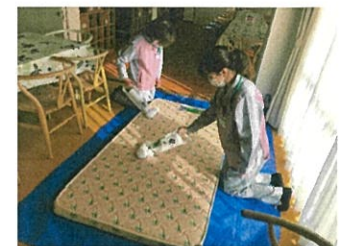
↑マットレス 清掃中...