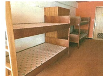
↑学生宿泊室 2段ベッド

より快適に施設をご利用いただくために、年一回、ゲストルーム・学生宿泊室の寝具のクリーニングを実施しております。 全ての枕、布団、毛布、ベッドパッド、マットレスを専門業者に依頼して実施しました。 クリーニング中は、学生宿泊室の2段ベッドも写真のようにすっきりした状態になっていましたよ！