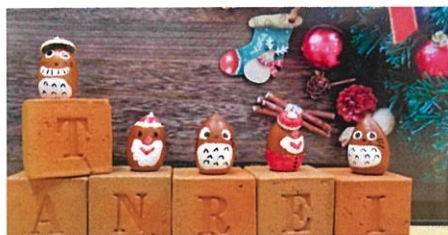
丹嶺のドングリで作りました

冬期は利用者も少なく、ゆっくりするにはぴったり！あまり知られていない冬の丹嶺の思い出を、たくさん作りにきませんか？