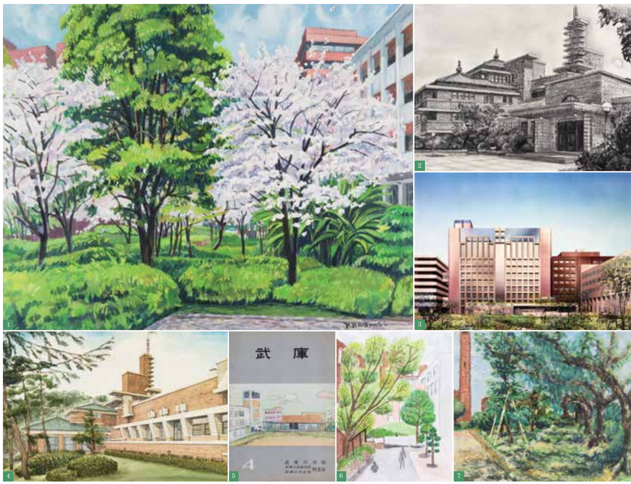
1. 油彩画「桜咲く学院庭1」中西清 2. 木炭画「甲子園会館 玄関」奥野元昭 3. パース 武庫川女子大学附属中央図書館(株式会社 竹中工務店) 4. 水彩画 無題 山田麻未(建築学科学生) 5. 印刷物「武庫4」岡野幸代(当時附属高等学校3年生) 6. 水彩画 無題 古賀未侑菜(生活環境学科学生) 7. 油彩画 無題 柳田梨衣(当時附属高等学校2年生)