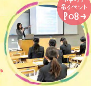
キャリア 系イベント Po8→