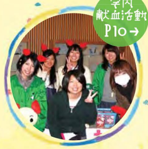
学内 献血活動 Po10→