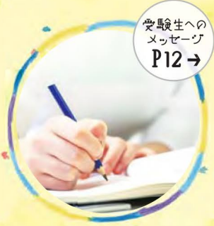
受験生への メッセージ Po12→