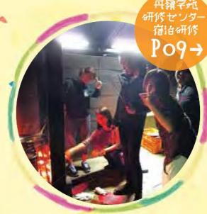
母体学苑 研修センター 個別研修 Po9→