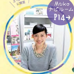
Muko ナビレーム Po14→ 土・日・祝日 に開催