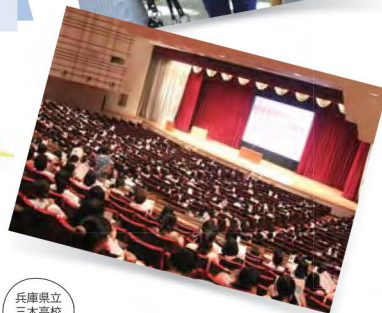
兵庫県立三木高校出身