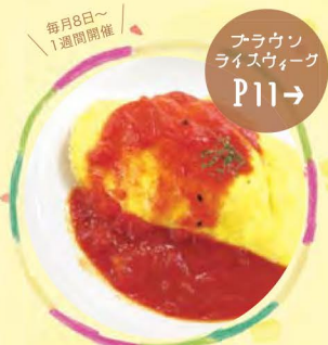
アラウン ライスウィーク Po11→ 毎月8日~ 1週間開催