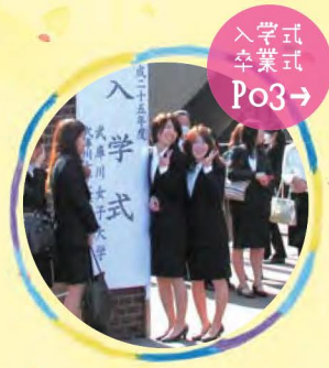
入学式 卒業式 Po3→

“ふるふるふる”は、もっと武庫女のこを受験生・高校生の皆さんに知ってもらいたい! という学生広報スタッフの思いから生まれました。もちろん、すでに武庫女には大学を紹介する資料はたくさんありますが、この“ふるふるふる”は、受験生・高校生の皆さんと年齢の近い私たち学生広報スタッフの目線で作ること、より一層、大学の魅力を伝えられるように努力しました。他にはない、武庫女オリジナルの冊子です。今号では、武庫女のイベントを紹介しています。大学をあけての一大イベントから在学生の間でもまだ認知度の低いものまで、多種多様なイベントを取り上げました。ぜひチェックして、武庫女生になった際には全力で楽しんでください!!