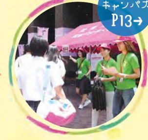
オープン キャンパス Po13→