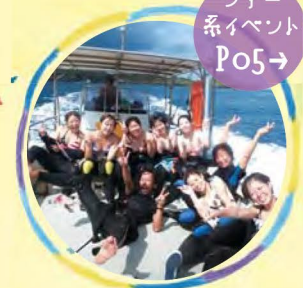
ツアー 系イベント Po5→