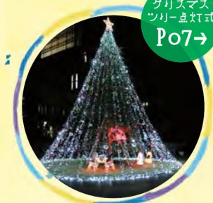
クリスマス ツリー点灯式 Po7→