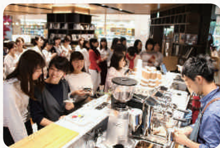
多くの学生でにぎわう図書館のカフェ

3月の卒業式の2日間、プレ販売をしました。式に参列した保護者の方がたくさん来てくれて「おいしかったよ」と言ってくださいました。大学で本格的なコーヒーを飲めるのが新鮮だったようです。実際にコーヒーを作るのはプロの方で、私たちはレジやホールを担当しました。一日目はバタバタして、コーヒーが間に合わず、焦ることもありましたが、二日目は売上も伸び、良い成果が得られました。