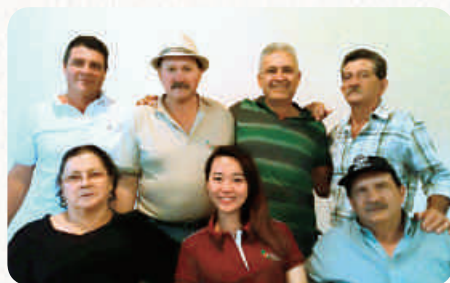
提携農園の生産者のみなさんと

見交換し、オーダーメイドで豆の乾燥工程をアレンジして作ってもらスタイルです。継続して買うことで互いの信頼関係が深まります。