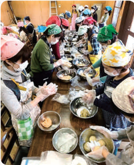
味噌作り挑戦するモニターツアーの参加者ら

この受賞がきっかけで、大阪府能勢町で味噌作りを体験するモニターツアーが実現し、約40人が参加してくれました。実際にやってみると、思い通りにいかないことも多かったけれど良い経験になりました。