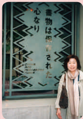
Los Angeles Public Library (ロサンゼルス公共図書館)

図書館は読書を通じて人を育む場です。本と人を結び付けるのが、図書館司書の役割です。一日に何百冊という本が私たちの前を通り過ぎます。武庫川女子大学は司書課程があり、約500人が履修しています。私も授業を担当し、司書の仕事を知っていただくために、一生懸命、学生に接しています。