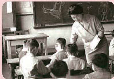
小学生を指導する在りし日の祖母