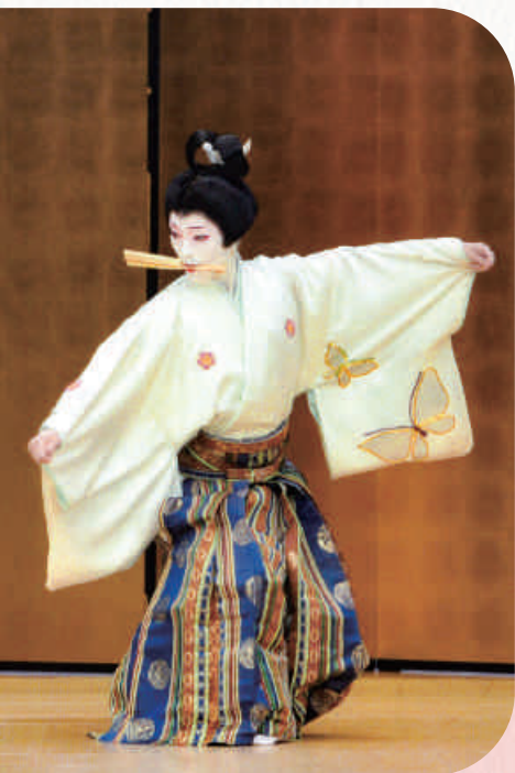
長唄「今様望月」 日本舞踊協会関西支部「なにわの会」で (国立文楽劇場)