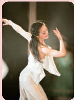
自身が主宰する「スタジオSMS」発表会で