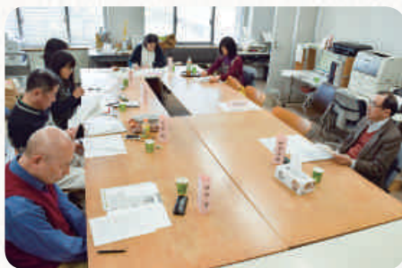
オトナのための日本語塾

「ですます調」、記号の多用、自分で書いておいて「なんでやねん」と突っ込む、「ですよね?」と語り掛ける文末表現——。書き手の真意を確かめるため、アンケートを取ったところ、「読み手を意識している」「意識していない」の両方の意見がありました。ただ、「意識していない」グループでも、読み手を意識した表現はあります。潜在意識に「自分を知ってほしい」「誰かとつながりたい」という願望があり、より伝えたいがために、記号で飾り立てたり、文字の大きさを変えたり、行間を大きく開けて、間を取るとか、表現上の技術を駆使する傾向が感じられました。