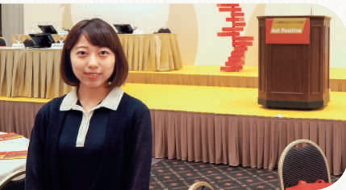
国際女性ビジネス会議の会場で