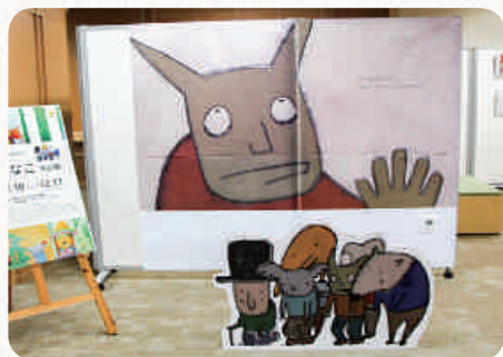
中央図書館で行われた ありさんの絵本展

も応募数が多いフジテレビKIDS主催の第8回be絵本大賞に応募しました。「一次審査だけでも通過できれば励みになる」と思っていたのが、なんと大賞を受賞。審査員が満場一致で選んでくださったと聞いて、号泣しました。小さいころから、私は周りに「変わっているね」と言われることが多く、自分の考えを理解してもらえない寂しさがあったんです。だから、自分の表現に共感し、認めてもらえたのが何よりもうれしかった。