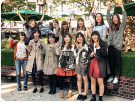
丸山ゼミの学生たち

今回、新しい試みとして、紙媒体に動画を載せました。酒蔵通りにあるレンガ館の吹きガラス体験を、動画で見ることができます。ページに掲載した写真に専用のアプリをかざすとガラス体験を映した映像が動き出します。360度見渡せるカメラで撮影した写真にも仕掛けがあります。この写真を同様にアプリで読み込み、スマホを目の前にかざすと、自分があたかもその場所に立ち、周囲を見ているように、空から地面まで見渡せます。写真だけでは伝わらないリアリティを感じてもらえると期待しています。