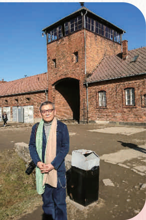
2018年3月 アウシュビッツで