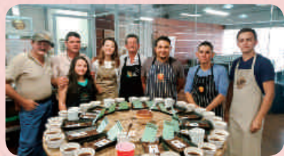
コーヒーのテイスティング