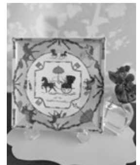
前期制作予定の作品例

頭で考えながら、そのイメージを指先を使って仕上げますので、脳の活性化につながり、一石二鳥!! 3歳から95歳まで幅広い年齢の方々が楽しんで制作されています。転写紙の配置、組み合わせ方で、デザインは自由自在!! 世界にひとつだけのオリジナル作品が完成。作る楽しさと実際に使う楽しみを謳歌しましょう。絵が描けない方でも完成度はとても高く、手作りとは思えない仕上がりになりますよ。初めての方にも丁寧に指導いたします。素敵なティーセットを作ってみましょう!