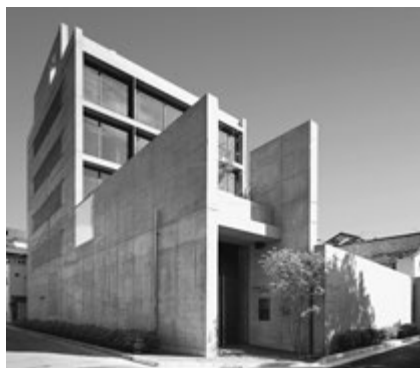
中央キャンパス IR（学術研究交流館） 阪神電車「鳴尾・武庫川女子大前駅」から 5 分