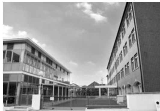
西宮北口キャンパス 阪急電車「西宮北口駅」から 5 分