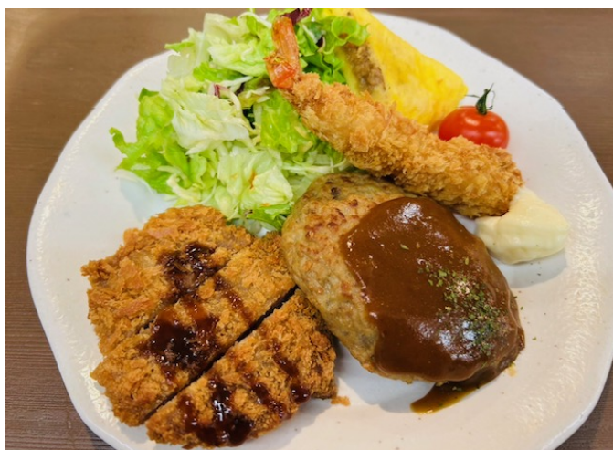
ハンバーグ&とんかつ&エビフライ