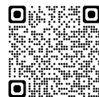
参加申込フォーム