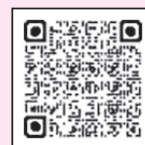
女性活躍総合研究所 HP▶