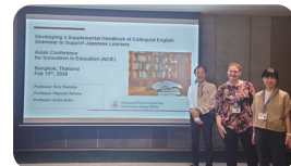
第6回アジア教育イノベーション会議(ACIE)にて