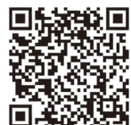
研究所 HP ロールモデルブックページ▶