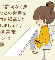
M*archのキャラクター むっこちゃん

授業担当者に許可なく黒板やスクリーンなどの板書を撮影したり、音声を録音したりしないようにしましょう。私語は慎み、携帯電話・スマートフォンはマナーモードに設定しましょう。