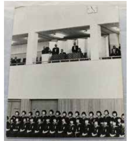
「モノクロパネル写真」(当館所蔵)

Museum News no.14 に掲載した「武庫川ヒストリー vol.5」では、「モノクロパネル写真」をご紹介しました。この写真は、昭和 31 年 (1956) に本学の体育館が国民体育大会の体操競技会場となったときに昭和天皇・香淳皇后が行幸された際の写真です。貴賓席に座られている昭和天皇・皇后の存在感に、整列している学生たちもかなり緊張している様子が伝わってきます。