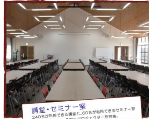
講堂・セミナー室 240名が利用できる講堂と、60名が利用できるセミナー室（3室）があります。各室にプロジェクターを完備。机・椅子はキャスター付きで、多様なレイアウトに対応できます。