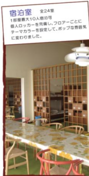
宿泊室 全24室 1部屋最大10人宿泊可 個人ロッカーを完備し、フロアごとにテーマカラーを設定して、ポップな雰囲気になりました。