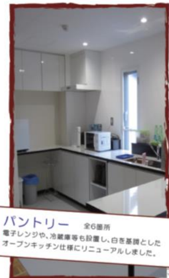
パントリー 全6箇所 電子レンジや、冷蔵庫等も設置し、白を基調としたオープンキッチン仕様にリニューアルしました。