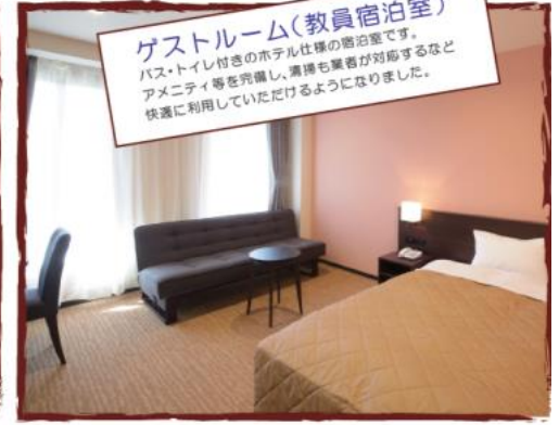
ゲストルーム(教員宿泊室) バス・トイレ付きのホテル仕様の宿泊室です。アメニティ等を完備し、講師も業者が対応するなど快適に利用していただけるようになりました。